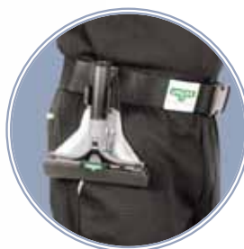
Porte-grattoir pratique pour la ceinture

Lames en acier inoxydable pour grattoir à vitres UNGER haut de gamme